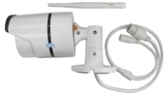
カメラ×2 (アンテナを含む)

・万一、不足や損傷しているものがあるときは、お手数ですがお買い上げの販売店または弊社へご連絡ください。