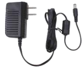
カメラ用 電源アダプタ×2