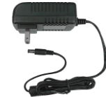
録画装置用 電源アダプタ×1