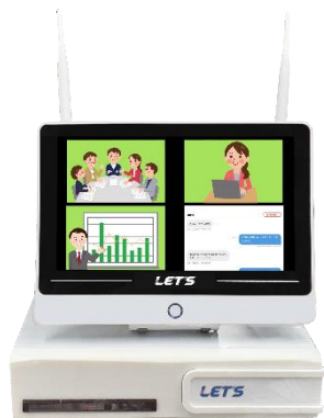
記録部(メイン装置・サブ装置) (電源アダプタ付属)