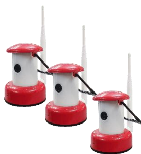
カメラ (電源アダプタ付属)