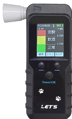
アルコール検知器本体